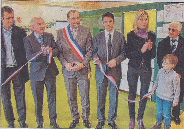
Le ruban inaugural a été coupé par les élus.